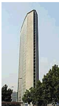
Il grattacielo Pirelli di Milano