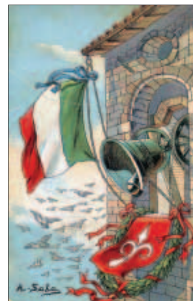
Archivio fondazione Micheletti (1918)

Tocca a noi fare agli italiani e ai lombardi una convincente offerta di governo. Per questo, la nostra opposizione è sempre più incisiva e le nostre proposte sempre più impegnative. Come sa chi segue il nostro lavoro.