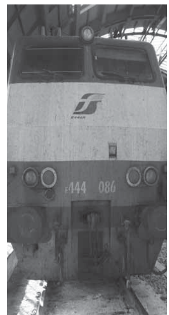
Nella tabella qui a lato, la spesa prevista per il 2007 nel Bilancio della Regione Lombardia. Per ogni voce importante si vede quanto il Governo Formigoni ha voluto investire. Ma è proprio sulla carenza generalizzata di investimenti che l'Ulivo ha posto le sue critiche e ha deciso di votare decisamente contro al documento contabile regionale.